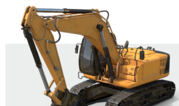
Excavatrice et excavatrice sur roue

Optimisez vos opérations d'excavation avec le système 2D GUIDE-PRO de e-Trak. Spécialement conçu pour les opérateurs, ce système avancé offre une précision inégalée, une efficacité accrue et des performances sans compromis budgétaires. Que vous réalisiez des travaux complexes de nivellement, de creusage de tranchées ou de terrassement, GUIDE-PRO garantit une plus grande précision, réduit les interventions supplémentaires et maximise la productivité, rendant chaque tâche plus fluide, plus rapide et plus fiable.